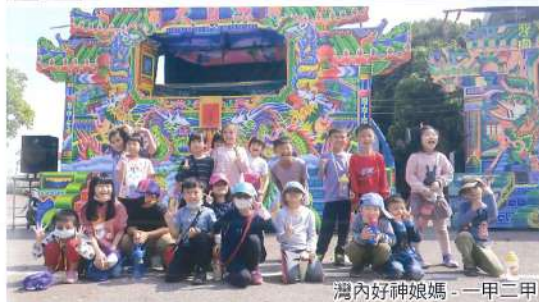
灣內好神娘媽- 一甲二甲