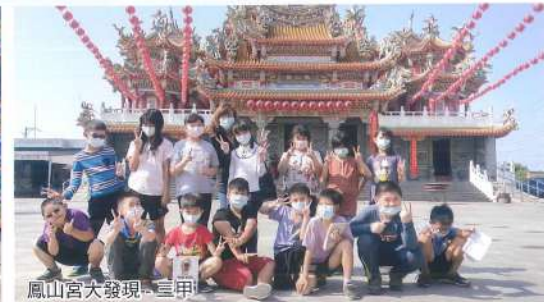
鳳山宮大發現- 三甲