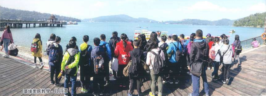
環境美感教學-日月潭