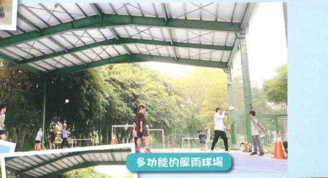
多功能的風雨球場