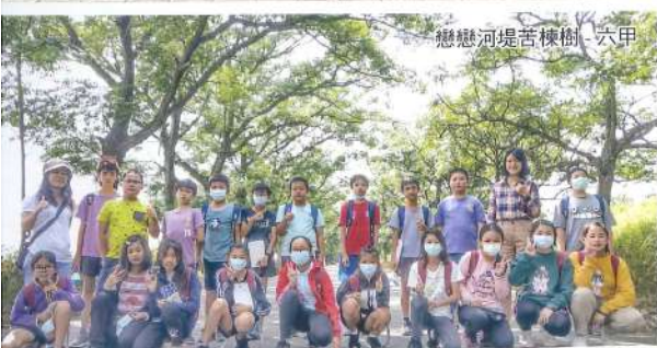
戀戀河堤苦楝樹- 六甲