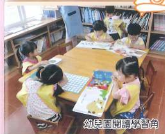
幼兒園閱讀學習角