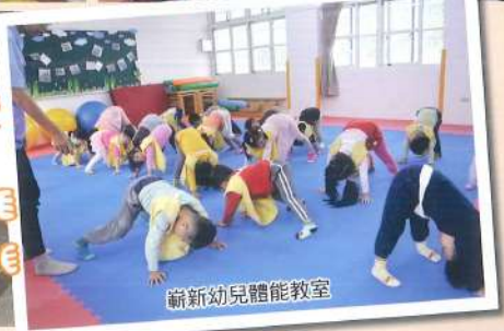
新新幼兒體能教室