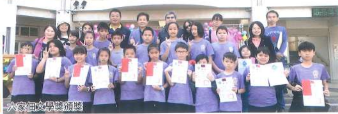
六家佃文學獎頒獎