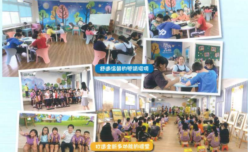
舒適溫馨的閱讀環境