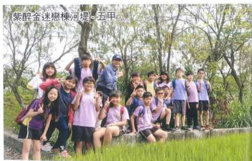
紫醉金迷戀楝河堤- 五甲