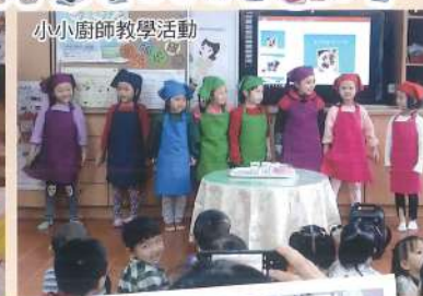
小小廚師教學活動