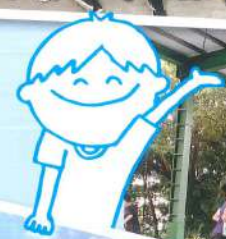
打造全新多功能的禮堂