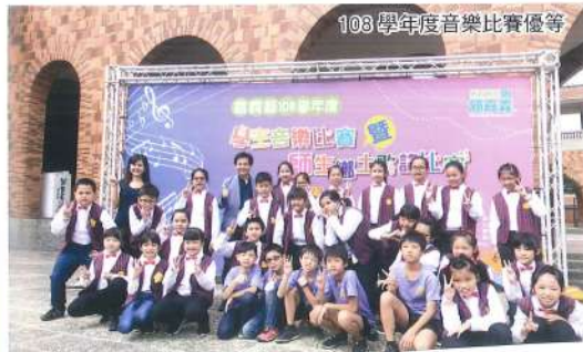
108 學年度音樂比賽優等