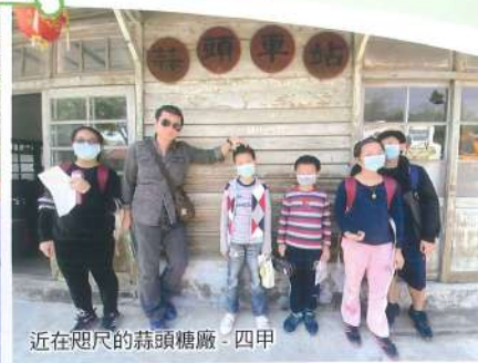
近在咫尺的蒜頭糖廠- 四甲