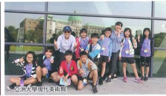
亞洲大學現代美術館