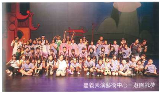
嘉義表演藝術中心- 遊園戲夢