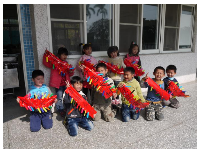
祝大家大吉大利、年年有餘