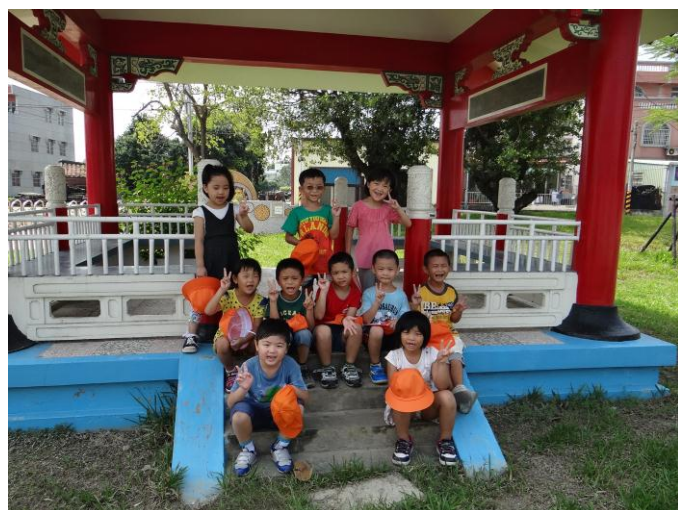
認識我們的學校—懷古涼亭