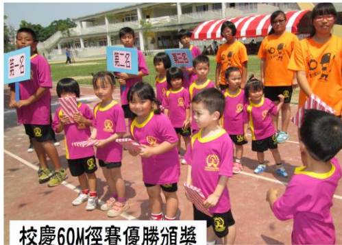
校慶60公尺賽優勝頒獎 校慶準備-趣味競賽練習