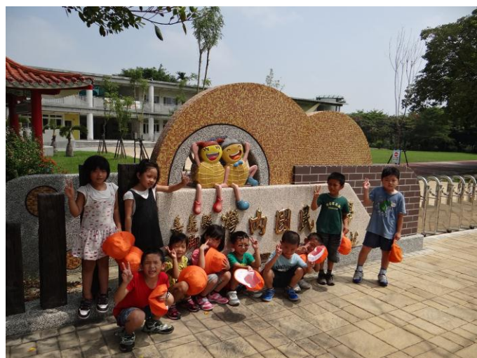
認識我們的學校—校門口