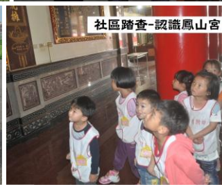
社區踏查-認識鳳山宮