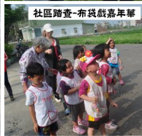
社區踏查-布袋戲嘉年華