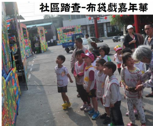
社區踏查-布袋戲嘉年華