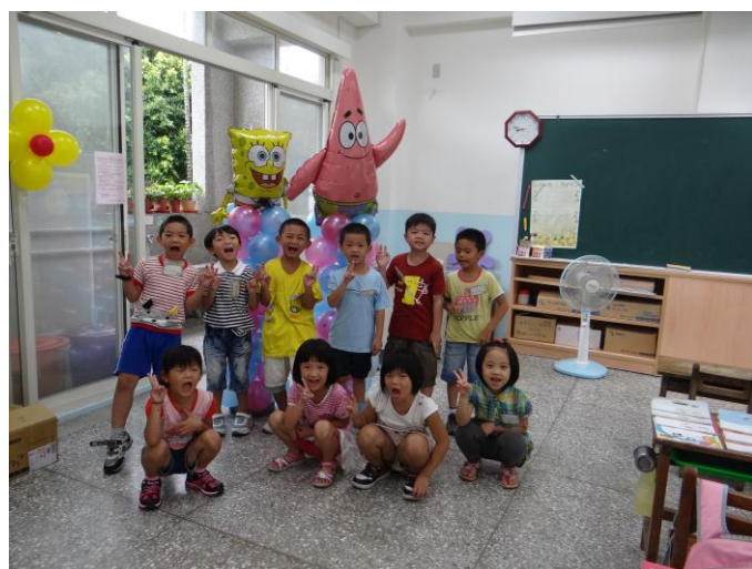
海綿寶寶、派大星迎接我們新生入學