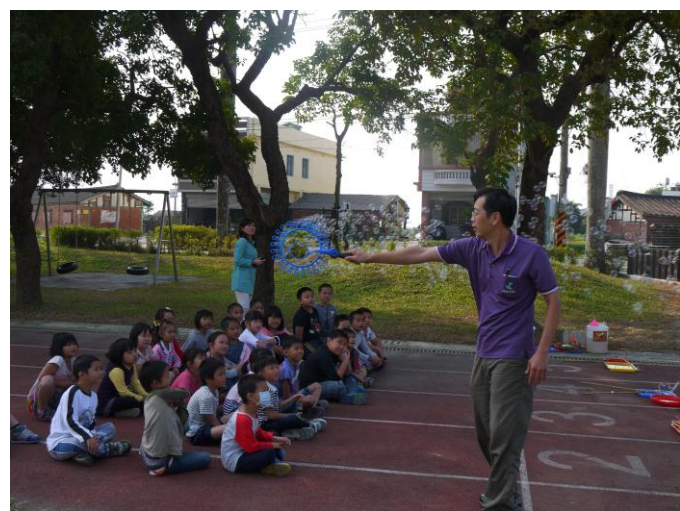
吹泡泡—柯南叔叔示範