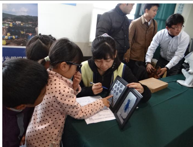
健康檢查—我的視力好不好呢？