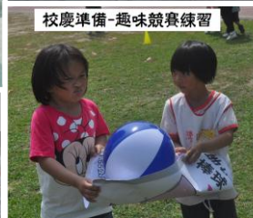
校慶準備-趣味競賽練習