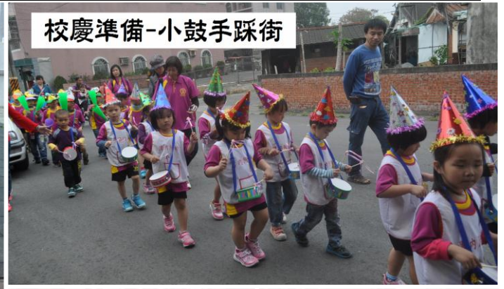
校慶準備-小鼓手踩街