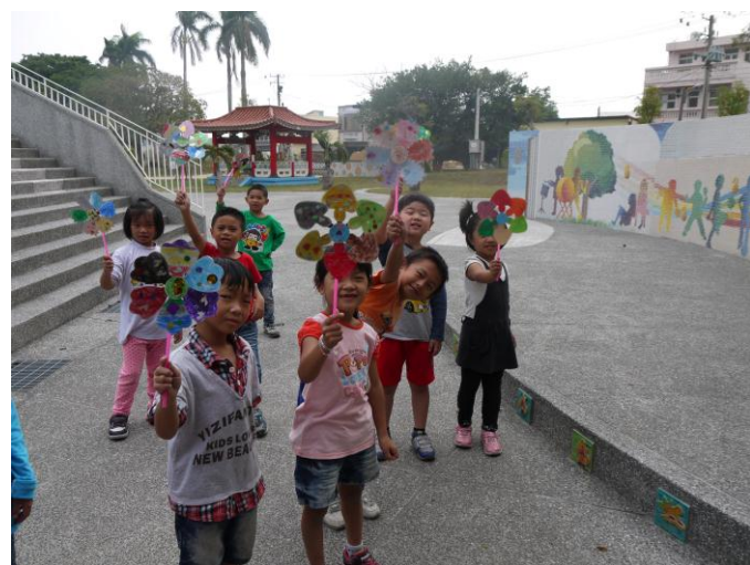
我的風車亮晶晶、風一吹就轉個不停