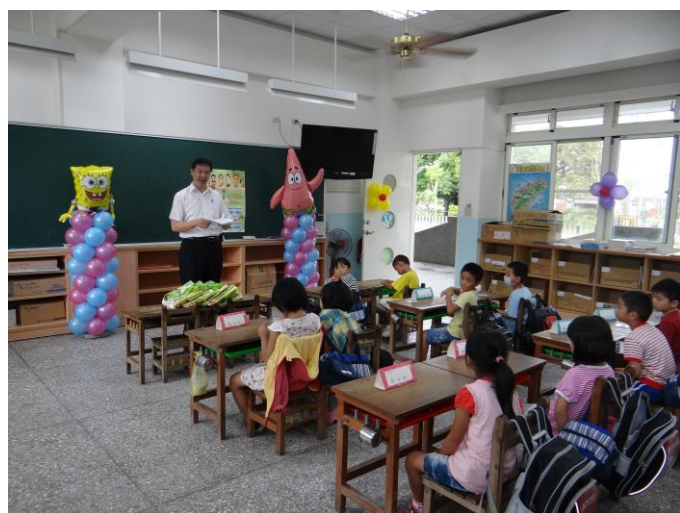
新生入學校長贈書