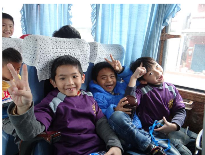
健康檢查—坐遊覽車好開心