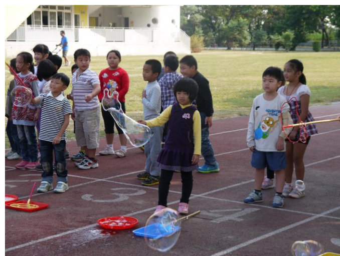
吹泡泡—我的泡泡好大！