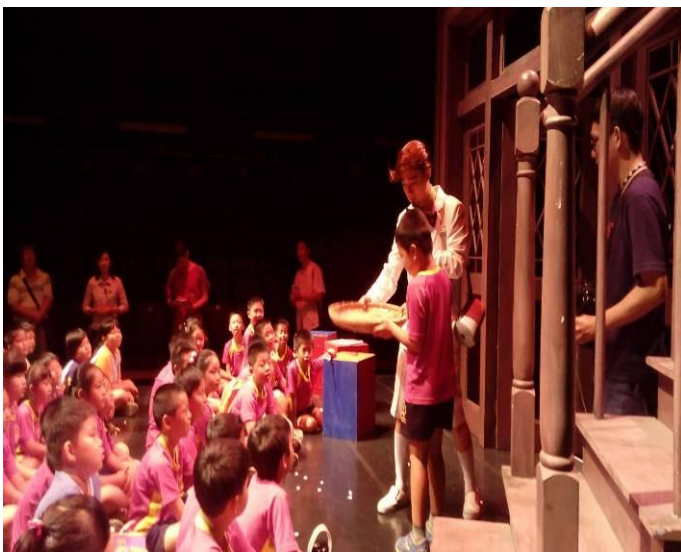
柏勳--搖用力一點，才會像下大雨！