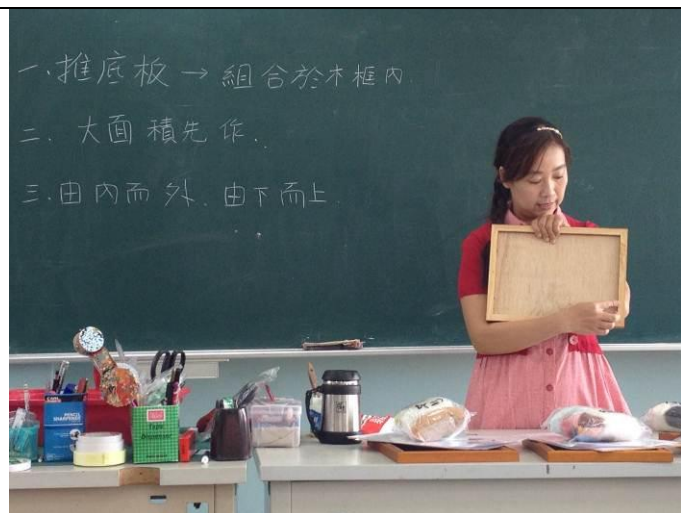
黏土課 (1) 老師講解