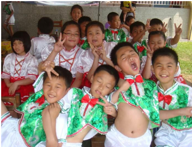
搞笑帥哥與溫柔美女大合照