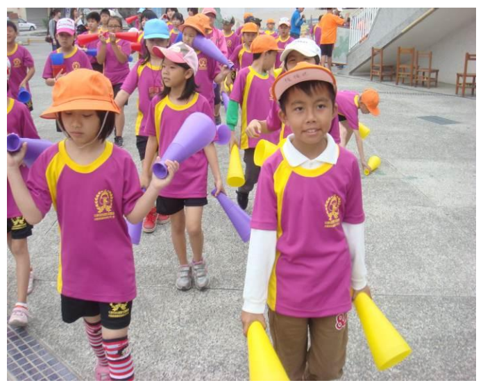
走走走，開開心心踩街去。