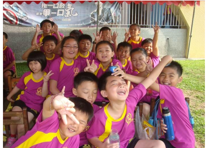
休息一下，玩得好快樂喔！