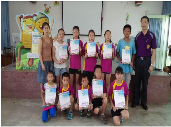
閱讀表現優異與師長合影