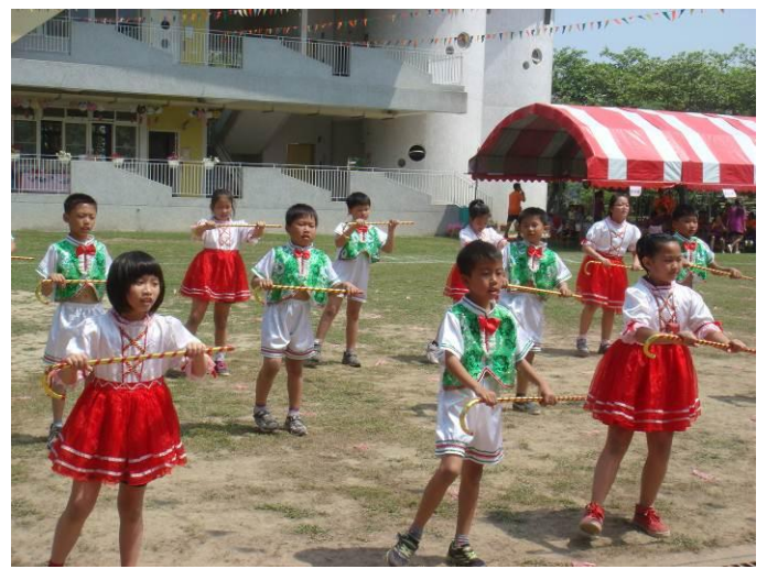
動感的「盛情百老匯」舞蹈表演