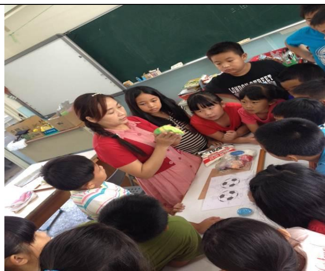
黏土課 (2) 老師示範