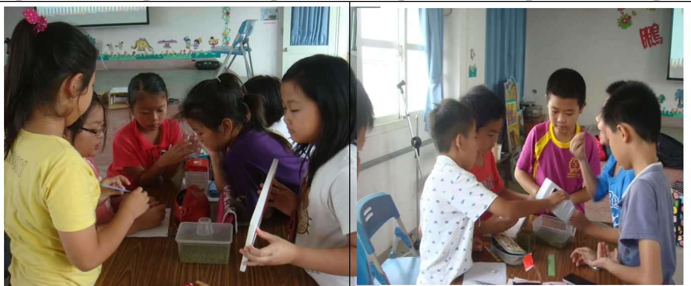
大家分工合作認真操作，比賽看哪一組最快用綠豆測量出正方形盒子的容量是多少？

今年的校慶在大家同心協力的努力之下，圓滿順利的結束了，這次的校慶有很多的比賽活動，讓我玩得好開心，希望每年校慶大家都可以像今年一樣玩得很盡興。