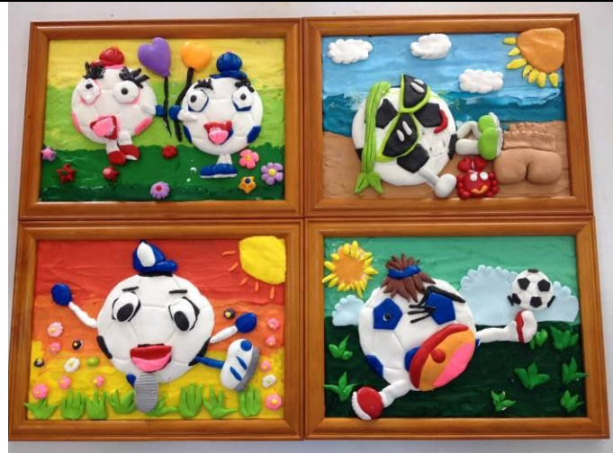
黏土課 (3) 作品