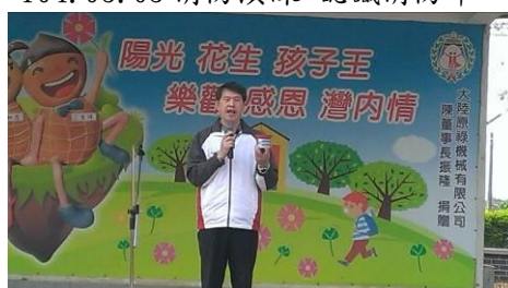
104. 03. 13 紫錐花反毒宣導