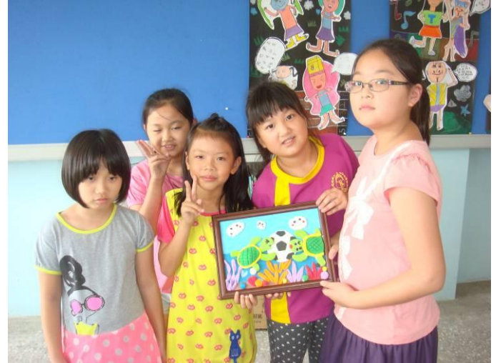
我們在蕭老師的指導下完成的足球主題紙黏土作品，是不是很漂亮啊！