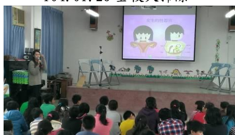
104. 03. 10 性教育宣導