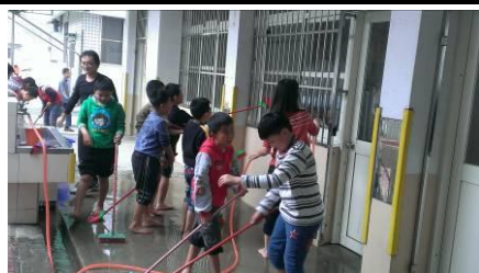
104. 01. 26 全校大掃除