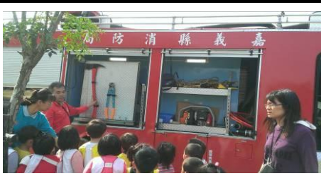
104. 03. 03 消防演練-認識消防車