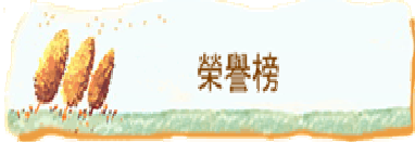
103 學年度第 2 學期寒假作業各班成績優異名單