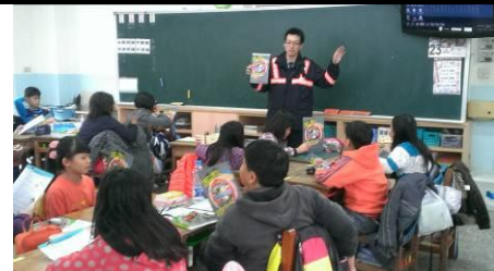
104. 01. 26 警察所到校反毒宣導