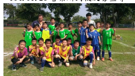
104. 03. 18 打貓盃足球比賽