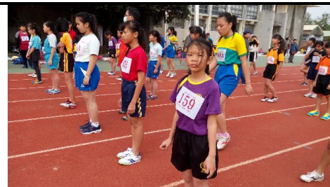
105.02.26 中小學運動會 60 公尺