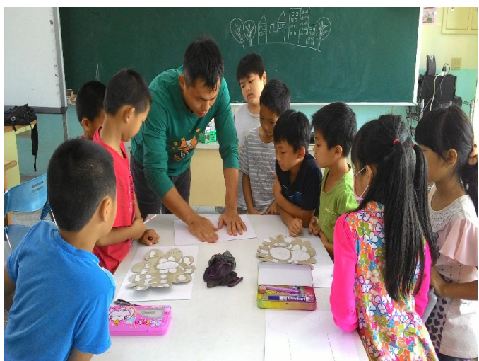
藝術深耕--版畫教學 (1)