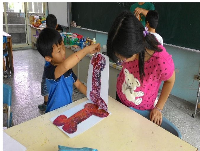
藝術深耕--版畫教學 (2)