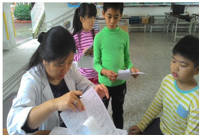
長庚醫療團隊到校檢查視力