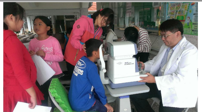
長庚醫生到校檢查