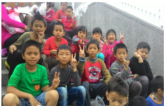
準備欣賞才藝表演