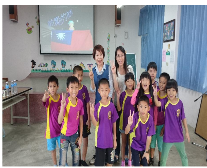
全班開心與超馬媽媽合影