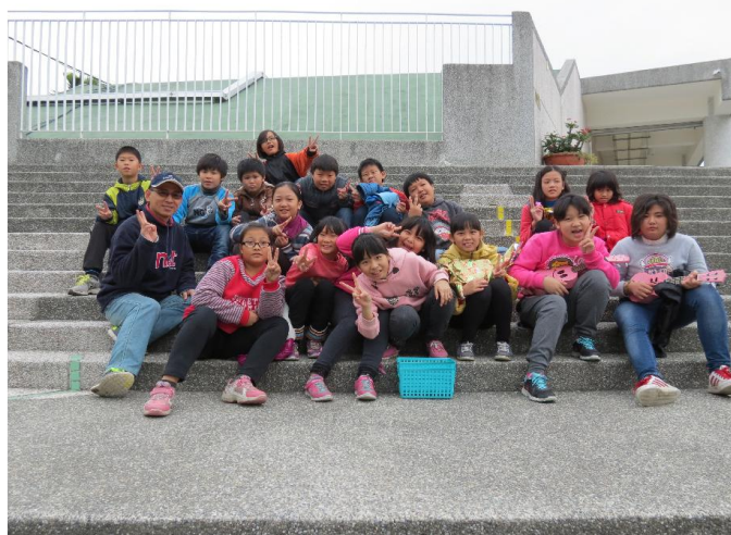
校內聖誕節活動後全班留影