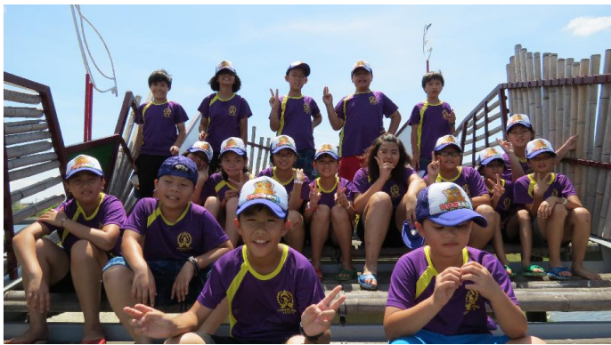
布袋鹽田體驗之旅