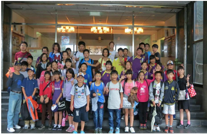
陽明書屋 2 天 1 夜校外教學