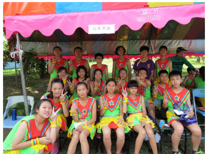
在校最後一次的校慶舞蹈演出