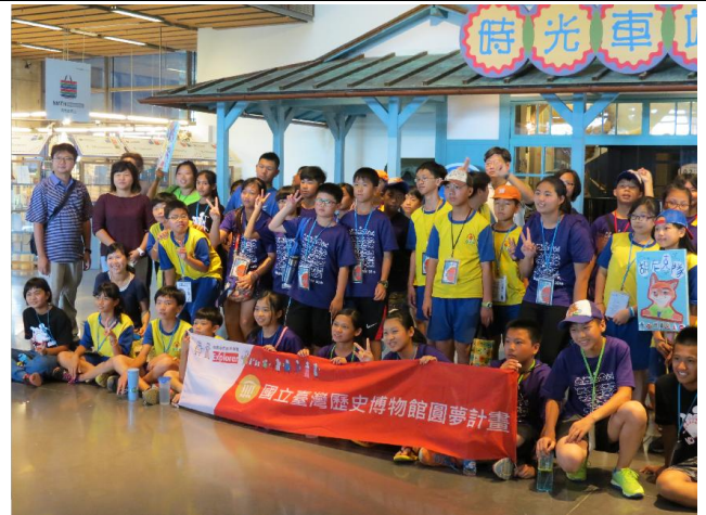
樹谷 2 天 1 夜畢旅活動