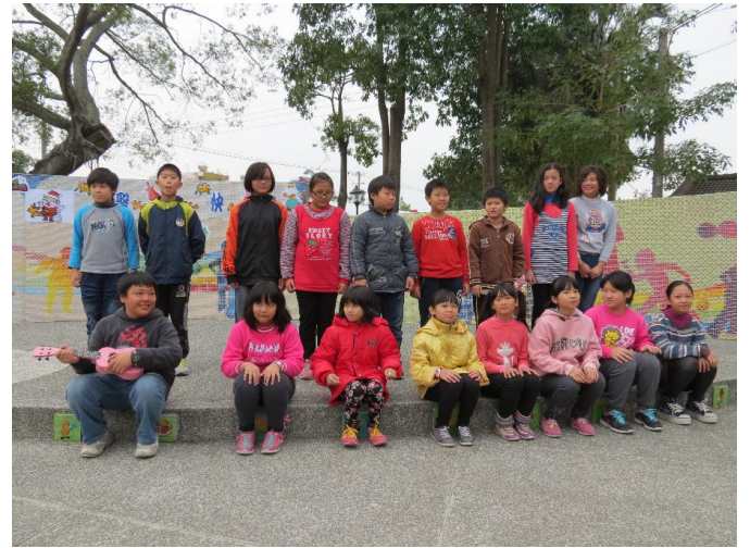
校內聖誕節活動：演唱小手拉大手！