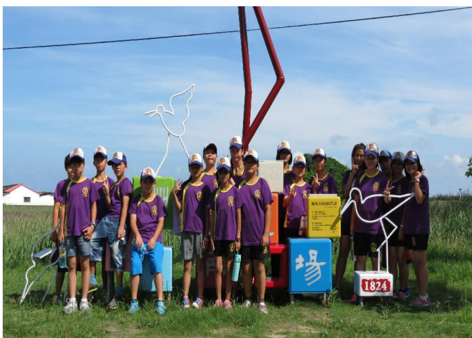
難忘的布袋鹽田體驗之旅！