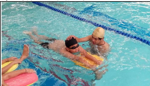
105.05.26 游泳課程 1