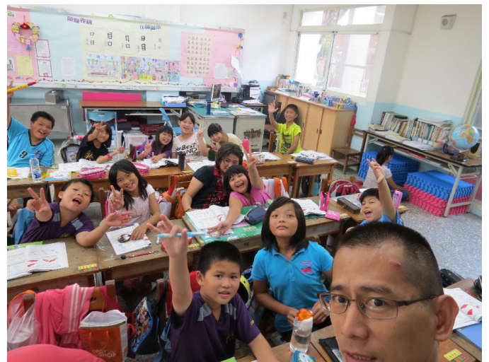
我們班上課就是這麼快樂哦！