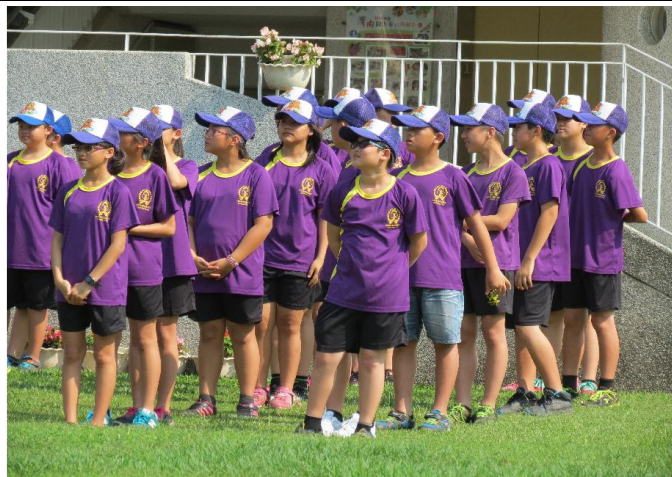
在校最後一次參加灣內國小的校慶了！