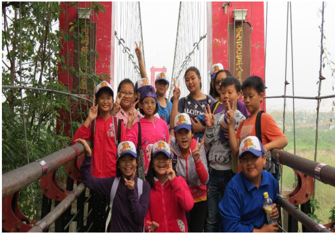
嘉教五讚上山下海體驗之旅