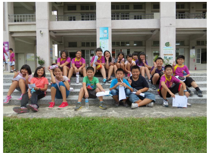
到六嘉國中參加科學體驗活動