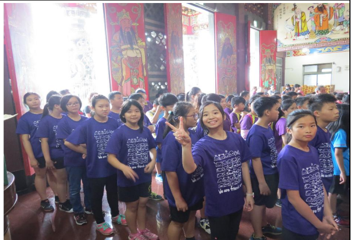
到鳳山宮拜拜，祈求一切都順利哦！