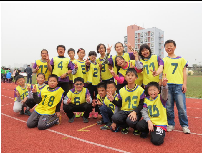
難忘的雨中樂樂棒球賽(在大同技術學院)