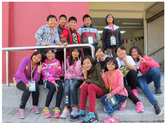
文光英語村 5 天 4 夜的英語學習活動！