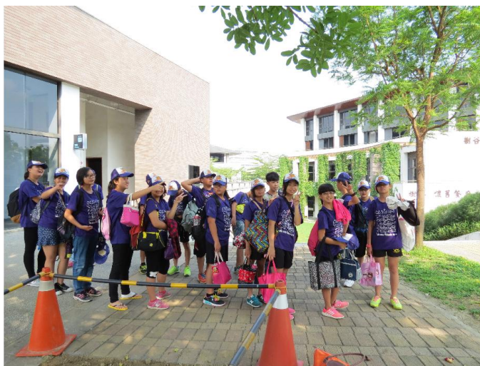
大包小包去樹谷科學園區玩跟學 2 天！