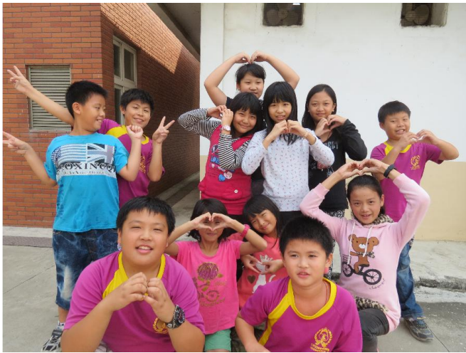
拍照表達一下我們的心意哦！