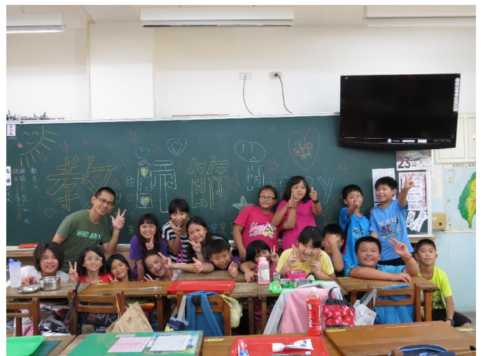
祝老師教師節快樂哦！