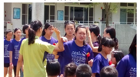
畢業典禮畢業生離校