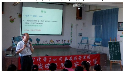
節電與用電安全宣導