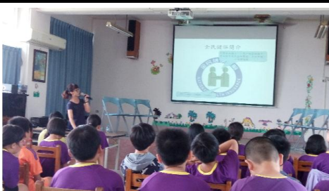
全民健保宣導活動