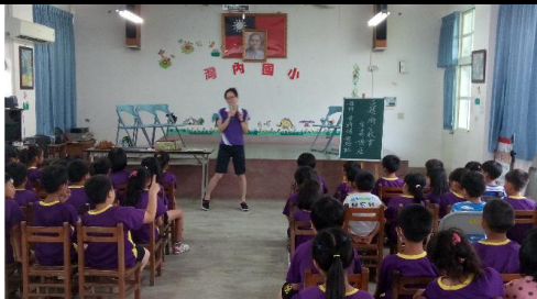
衛生所蒞校進行衛教宣導