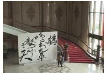
圖 5-2-3 董陽孜（自在·字在）展覽局部作品