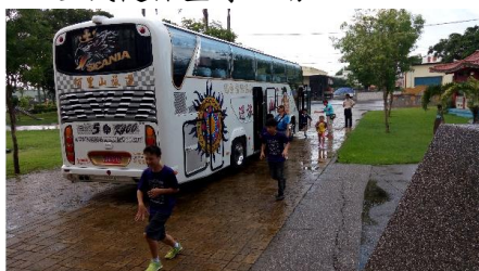
校外教學行前安全演練