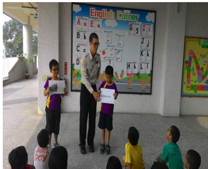
替代役哥哥教我們學英語