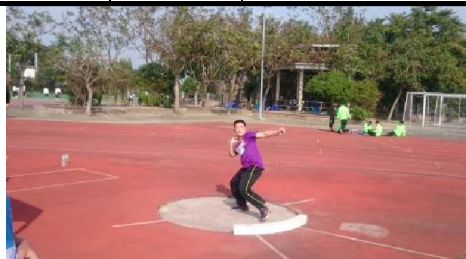
106.02. 嘉義縣中小學運動會