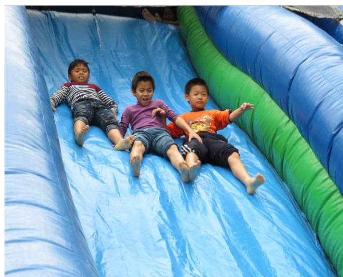
好玩刺激的滑水體驗