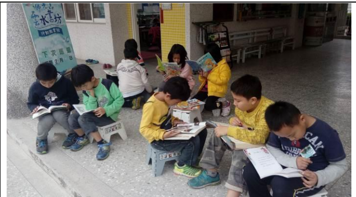
雲水書車到校服務