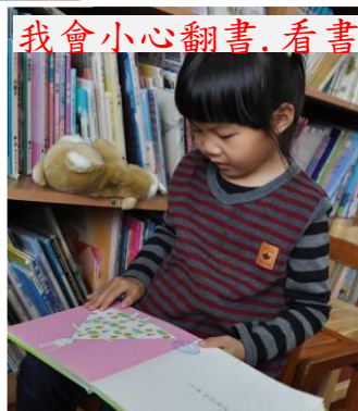
我會小心翻書, 看書