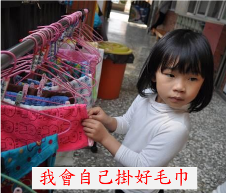
我會自己掛好毛巾