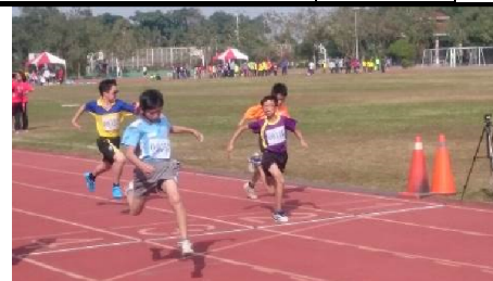
106.02. 嘉義縣中小學運動會