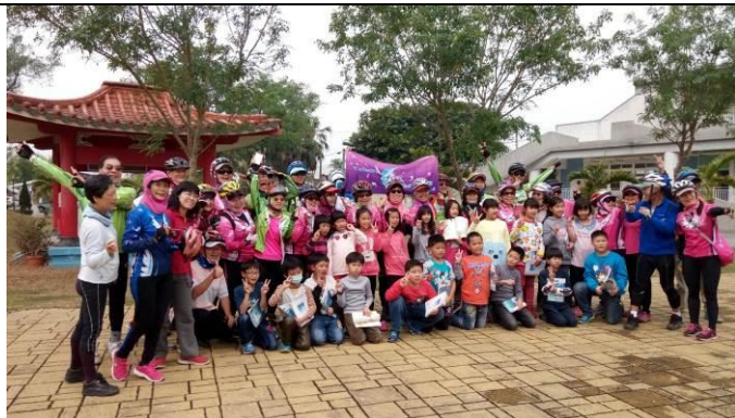
與追風車隊大合照