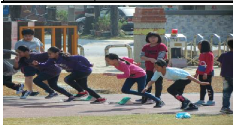
106.02. 體育課起跑練習(五甲)