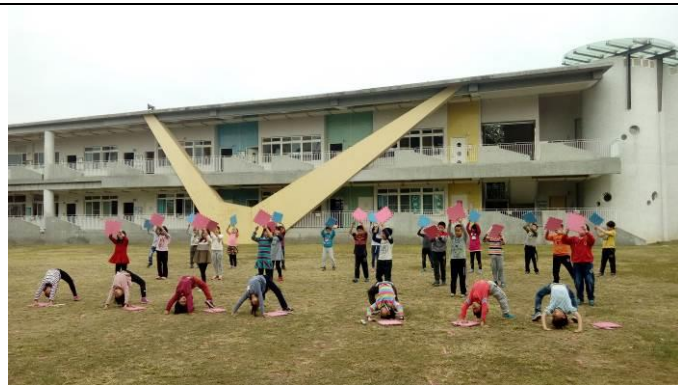
我們認真練習舞蹈的基本動作